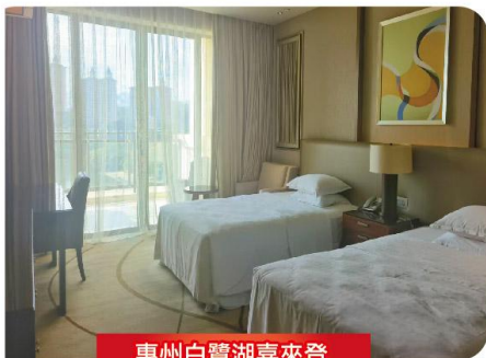
惠州白鷺湖喜來登

日期時間 出發日期: 2026年2月14-22日 (天天開團) 集合日期: (逾期不候) 11:00深圳灣口岸集合 / 12:00福田口岸