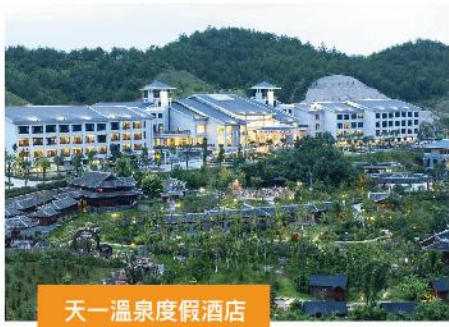
天一溫泉度假酒店