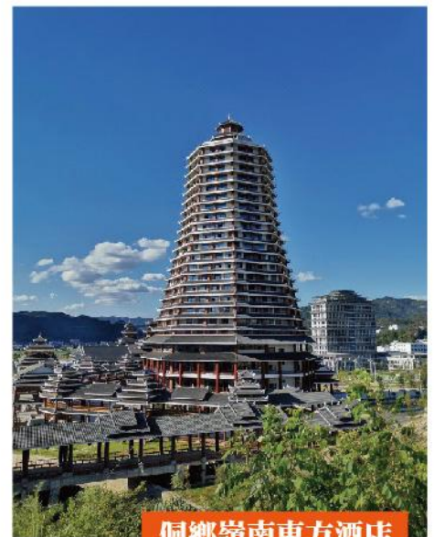
侗鄉嶺南東方酒店