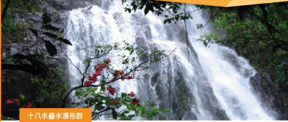
十八水疊水瀑布群