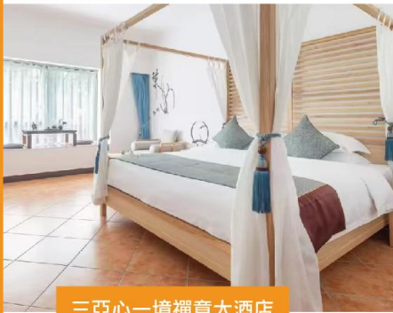
三亞心一境禪意大酒店