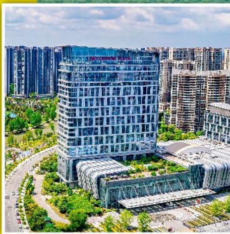
溫江皇冠假日酒店外觀