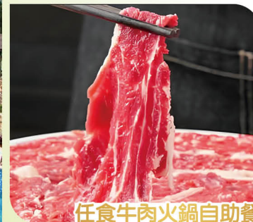
任食牛肉火鍋自助餐